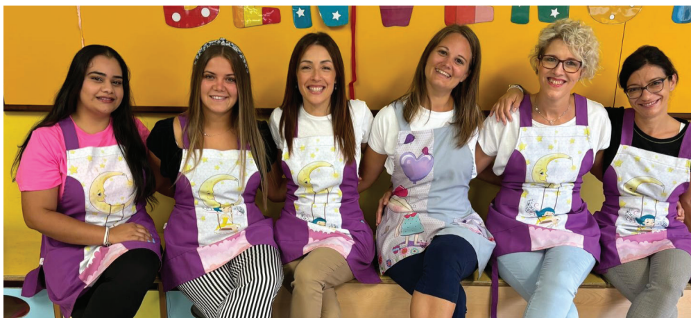
Le educatrici e le insegnanti della scuola